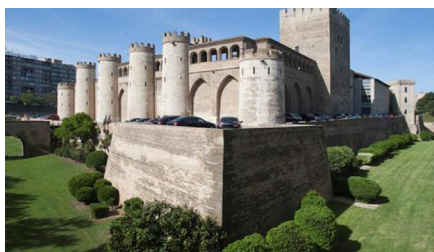
Recepción y Cóctel de bienvenida Palacio de la Aljafería Calle de los Diputados, s/n, 50003 Zaragoza