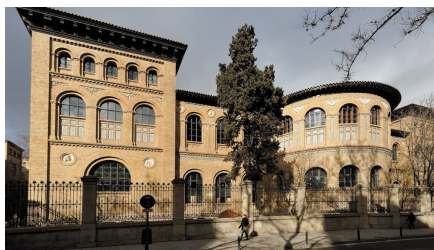
Sede Edificio Paraninfo de la Universidad de Zaragoza Plaza Basilio Paraíso, 4, 50005 Zaragoza