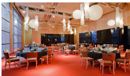
Cena del congreso Hotel Alfonso **** Calle del Coso, 15-17-19, 50003 Zaragoza